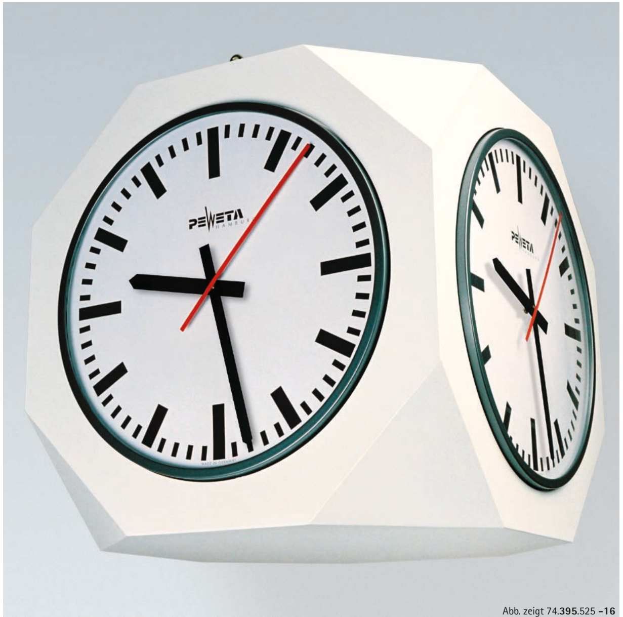
Abb. zeigt 74.395.525 -16

Uhrenwürfel mit Metallgehäuse in robuster Industriequalität für große Hallen und publikums- wirksame Bereiche – aus allen Richtungen immer die korrekte Zeit!