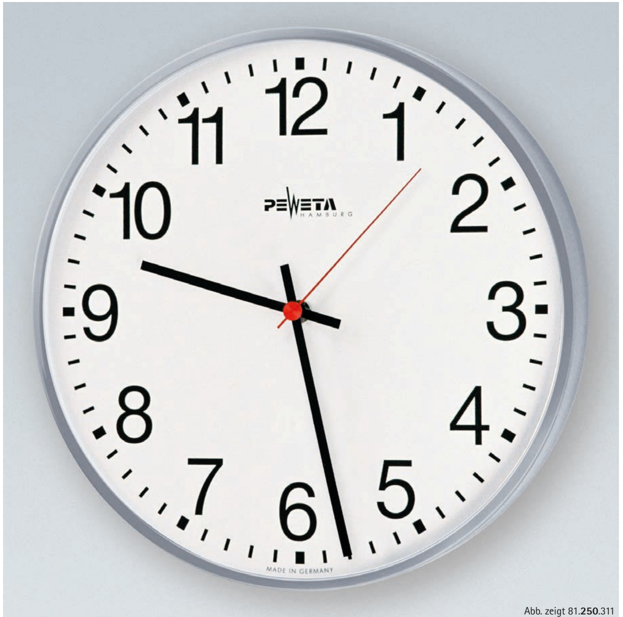
Abb. zeigt 81.250.311

Repräsentative Wanduhren für anspruchsvolle Umgebungen – die professionellste Art, die Uhrzeit anzuzeigen.