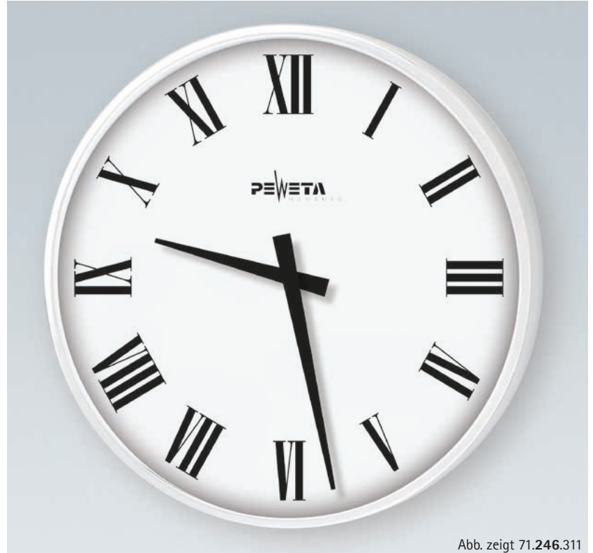
Abb. zeigt 71.246.311